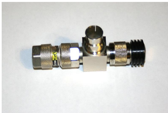
Рисунок 5 – Общий вид ВЧ тройника (ПРШН411252.020-04) с согласованной нагрузкой 50 Ом (ПРШН411252.020-05)